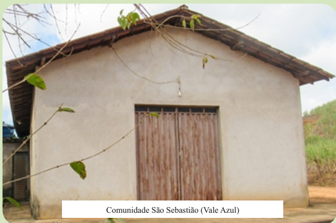
Comunidade São Sebastião (Vale Azul)