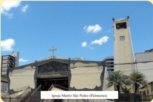
Igreja Matriz São Pedro (Palmeiras)